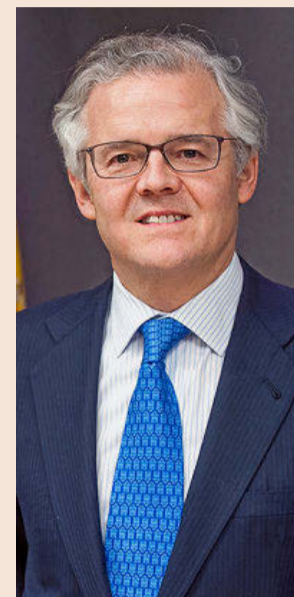
Sebastián Albella, presidente de la CNMV.

El Real Decreto permite también a la CNMV poner toques al apalancamiento de las gestoras y le habilita a imponer colchones de liquidez a los fondos de inversión si ve