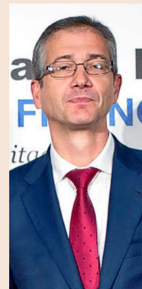
Pablo Hernández de Cos, gobernador del Banco de España.

riesgos de salidas masivas de aportaciones en situación de tensión de los mercados.