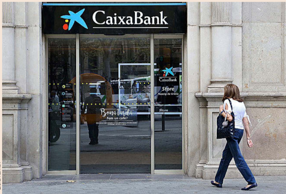
El plan de pensiones de los empleados de CaixaBank es el mayor de esta modalidad en España.

El plan canalizó el año pasado el 80% de su cartera, tanto de renta fija como variable, a través de gestoras. Entre las principales, el 7,2% se encauzó hacia Pictet y el 5,55% a Fide-