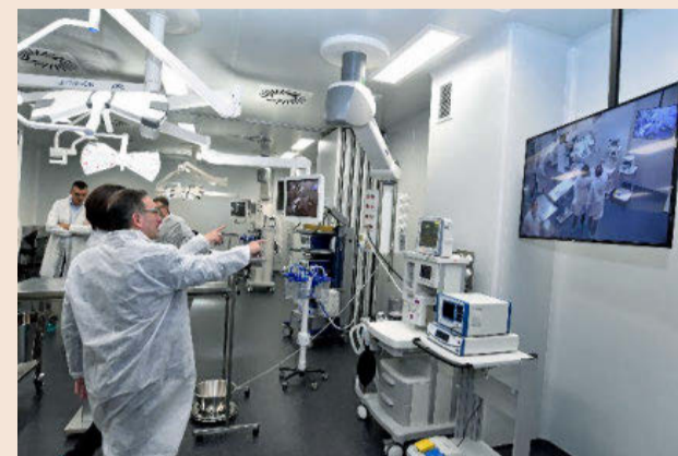
Jaume Giró, director general de la Fundación Bancaria La Caixa, visitando las instalaciones del CMCiB.