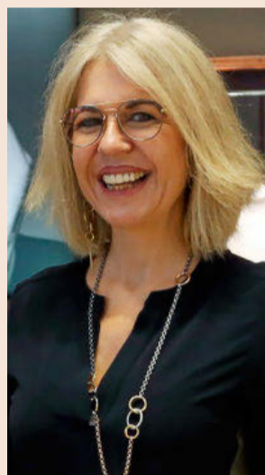
Alba Tous, presidenta de la firma de joyería Tous.